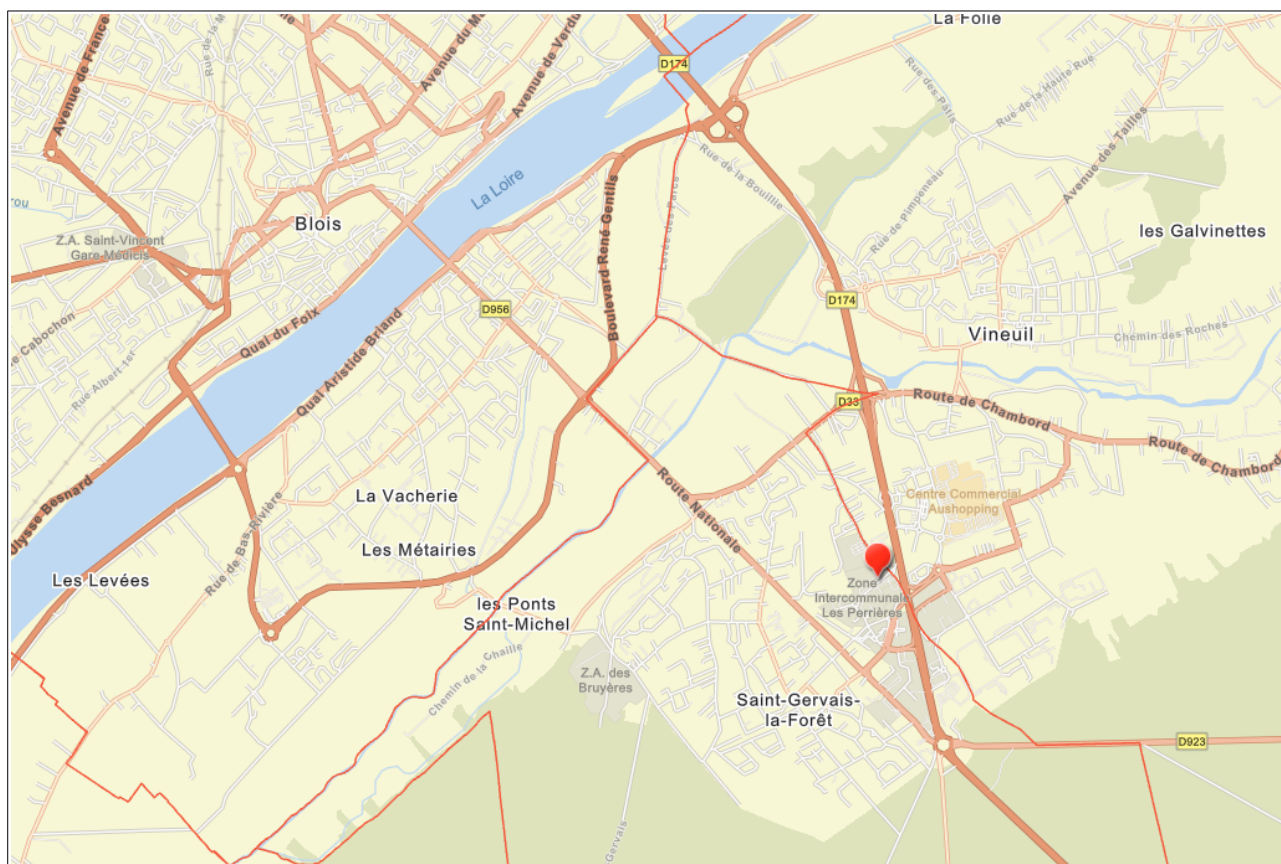
Plan de situation de la ZAC « Les Perrières »

La Zone d'Aménagement Concerté (ZAC) « Les Perrières » se situe au sud de l'agglomération bloisaise, sur les communes de Saint-Gervais-La-Forêt et Vineuil, entre la Route Nationale (RD 956 B) à l'ouest et la voie rapide (RD 956) à l'est, et entre la rue du Moulin à Vent et son quartier d'habitation au nord et la zone d'activités des Clouseaux au sud.