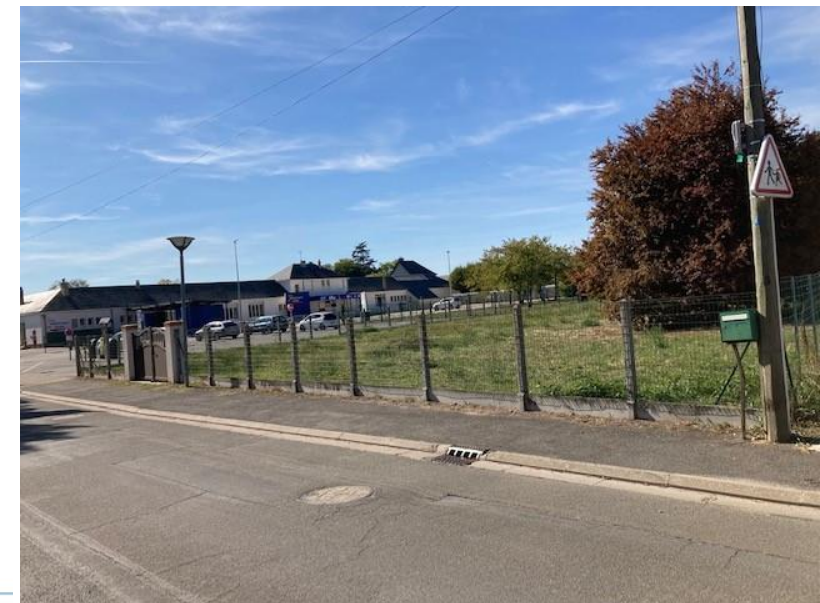
Vue du terrain de la rue des Petits Chemins